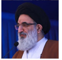
آیت‌الله حسینی‌همدانی در خطبه‌های نماز جمعه کرج:

بیانی ساده از مسئله خصوصی سازی، مشکلات بیمارستان امام خمینی (ره) و راه حل‌ها